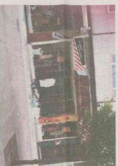
El incidente dejó notables desperfectos

La Universidade da Coruña acogerá los próximos días 19 y 20 de julio un curso que tratará sobre si se debe o no reformar el estatuto de Galicia. Las jornadas durarán desde las diez de la mañana hasta las ocho y media de la tarde con una pausa para comer y consistirán en una serie de conferencias impartidas por profesores procedentes de otras universidades españolas.